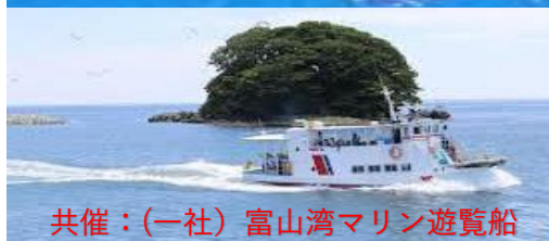
共催：(一社) 富山湾マリン遊覧船