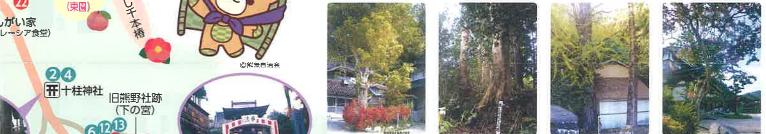
20 長九郎のモチ 21 丸山家下敷の辛夷 22 坂家の大公孫樹 23 専徳寺の百日紅