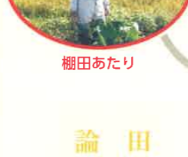
くまなし長谷川果樹園(東園)