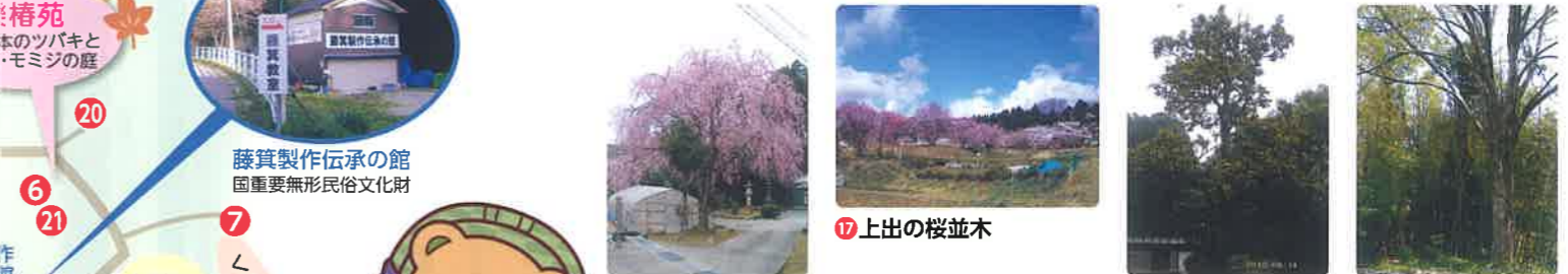
16 権右エ門の枝垂桜 17 上出の桜並木 18 六助の泰山木 19 垣地家の大ケヤキ