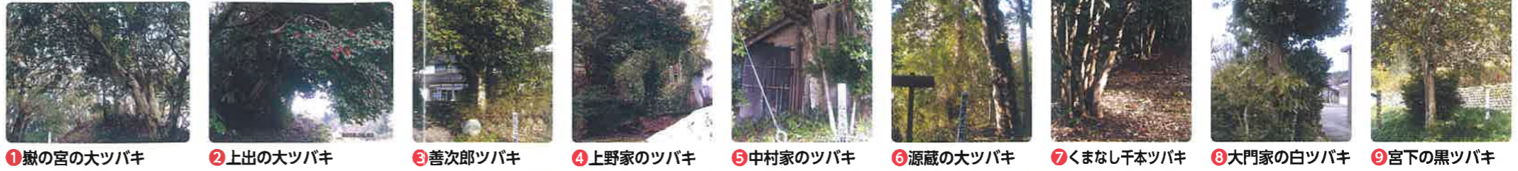
1 嶽の宮の大ツバキ 2 上出の大ツバキ 3 善次郎ツバキ 4 上野家のツバキ 5 中村家のツバキ 6 源蔵の大ツバキ 7 くまなし千本ツバキ 8 大門家の白ツバキ 9 宮下の黒ツバキ