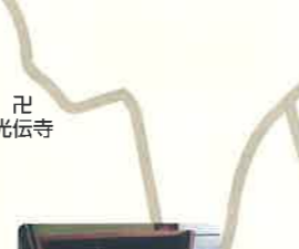
くまなし千本ツバキ