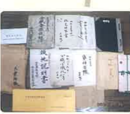
13 熊無青年団活動記録資料