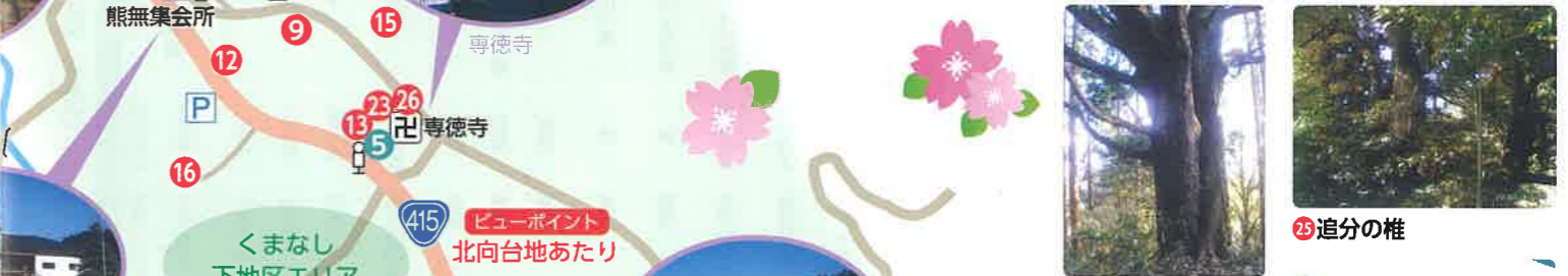
24 上野の赤檜 25 追分の椎 26 専徳寺の白フジ