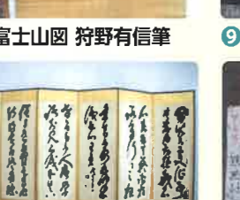
11 山岡鉄舟 寒山詩屏風