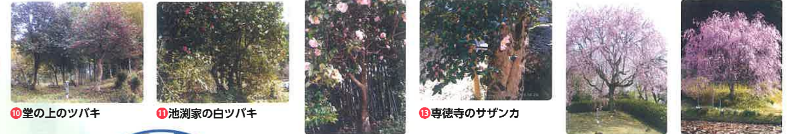
10 堂の上のツバキ 11 池淵家の白ツバキ 12 長四郎ツバキ 13 専徳寺のサザンカ 14 中の宮の枝垂桜 15 源三郎の枝垂桜