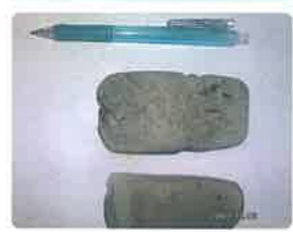
1 石斧(せきふ) I