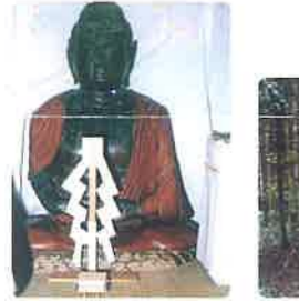
2 十柱神社の古仏像(木像)