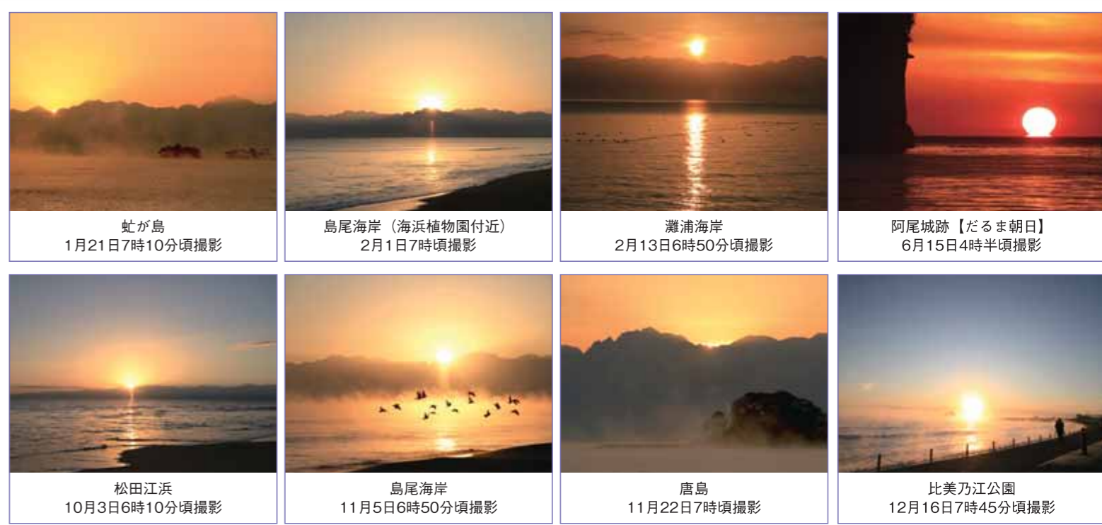
立山連峰から昇る朝日 立山連峰と蛇ヶ島を上記の位置関係で撮影した場合に見える朝日の目安です。